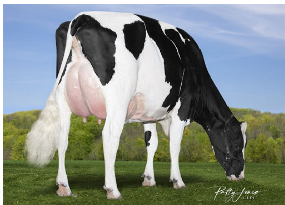
SILVERRIDGE V MARIUS EVICTION DAUGHTER