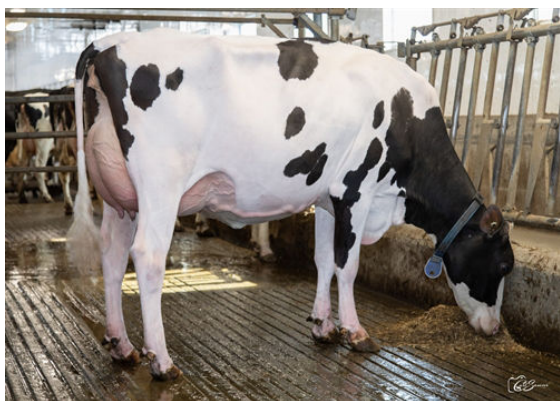
PROGENESIS MARIUS TANYA